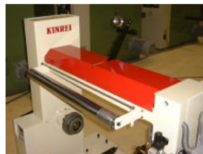
(テンションヘッド部)